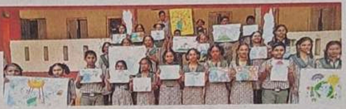
చిత్రాలు ప్రదర్శిస్తున్న పాతపట్నం ప్రభుత్వ ఉన్నత పాఠశాల విద్యార్థులు

ఓజోన్ పొర జీవరాశికి రక్షణ కవచమని వక్తలు పేర్కొన్నారు. అంతర్జాతీయ ఓజోన్ పొర పరిరక్షణ దినోత్సవం సందర్భంగా మంగళవారం టెక్నాలి, పాతపట్నం, నరసన్నపేట నియోజకవర్గాల వ్యాప్తంగా విద్యాలయాల్లో ప్రత్యేక కార్యక్రమాలు నిర్వహించారు. చిన్నారుల ప్రదర్శనలు ఆకట్టుకున్నాయి. సూర్యుడు నుంచి వెలువడే హానికరమైన అతి నీల లోహిత కిరణాలు భూమిపై పడకుండా ఓజోన్ పొర కాపాడుతుందని, దీన్ని కాపాడుకునేందుకు ప్రతి ఒక్కరూ కృషి చేయాలని ఉపాధ్యాయులు సూచించారు. అనంతరం ర్యాలీలు నిర్వహించారు. - న్యూస్టుడే బృందం