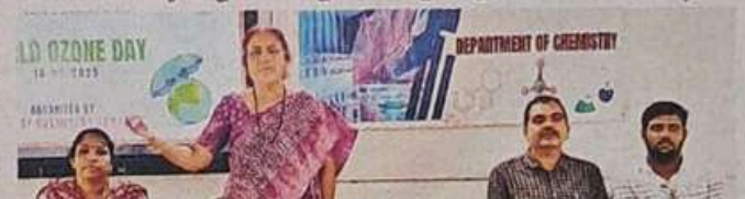
నరసన్నపేట: మాట్లాడుతున్న ప్రభుత్వ డిగ్రీ కళాశాల ప్రిన్సిపల్ లత